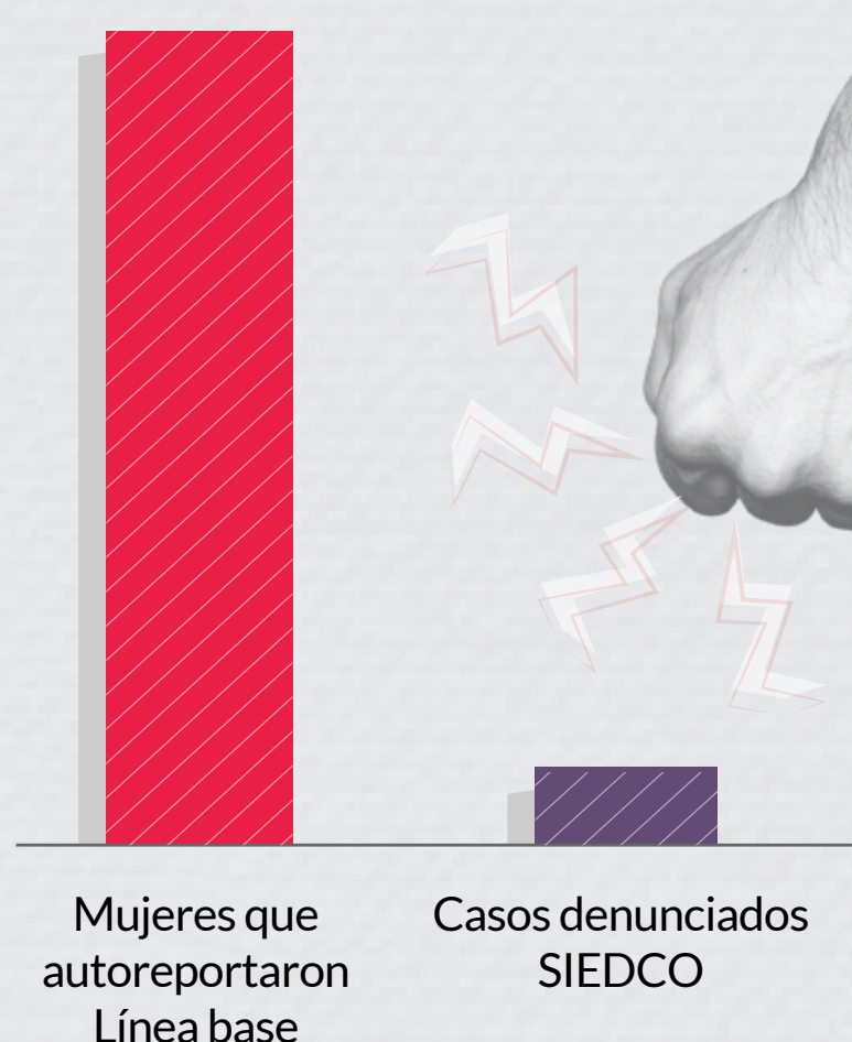
Violencias intrafamiliar contra las mujeres en Bogotá 2020 a 2021