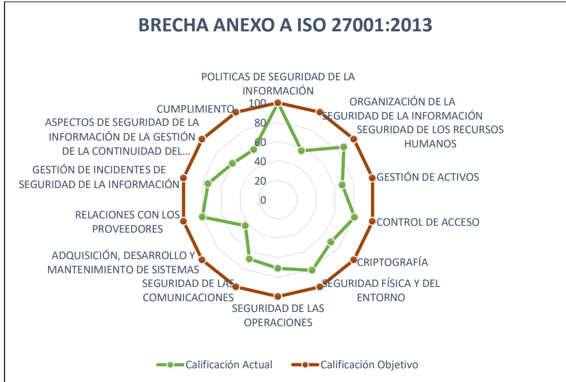
Ilustración 1 - Calificación de madurez de controles ISO27001:2013